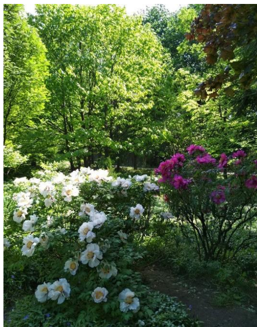
Рис. 1. Фрагменты экспозиции «Редкие древесные растения» Донецкого ботанического сада

В составе экспозиции 36 видов, 1 подвид, 1 форма, 1 разновидность, 1 сорт, относящиеся к 24 семействам (табл. 1). Семейства Fagaceae и Rosaceae представлены 4 таксонами каждое; Cupressaceae, Oleaceae и Sapindaceae – 3 таксонами; Betulaceae и Magnoliaceae – 2; остальные семейства – одним таксоном.