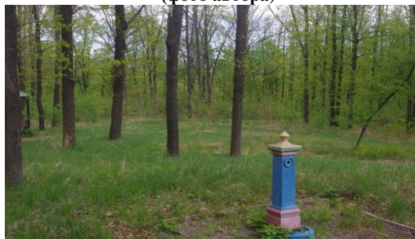
Рис. 5 Дубовые насаждения вокруг Поляны сказок

Во второй зоне представлены искусственные посадки дуба черешчатого ( Q. robur L.), возрастом 45–60 лет, робинии лжеакация ( Robinia pseudoacacia L.) между полотном Детской железной дороги и берегом реки Кальмиус, которые разделяет проспект 75-летия ФК «Шахтер». В этой зоне также встречается яблоня ранняя лесная ( Malus sylvestris L.), груша обыкновенная ( Pyrus communis L.), ясень обыкновенный ( Fraxinus excelsior L.), клен полевой ( Acer campestre L.) (рис. 6, 7). В данной зоне хорошо сформирован подлесок из кустарниковых и травянистых культур. Кустарниковые культуры представлены боярышником обыкновенным ( Crataegus laevigata L.), терном степным ( Prunus stepposa L.), жостером слабительным ( Rhamnus cathartica L.), чернокленом ( Acer tataricum L.), бузиной черной ( Sambucus nigra L.), шиповником ( Rosa cinnamomea L.). Травянистые культуры представлены следующими видами: лопух ( Aretium lappa L.), пырей ( Elytrigia repens L.), репешок ( Agrimonia eupatoria L.), чистотел ( Chelidonium majus L.), шалфей двух видов ( Salvia tesquicola и S. nutans L.). Этот участок почти не несет рекреационной нагрузки.