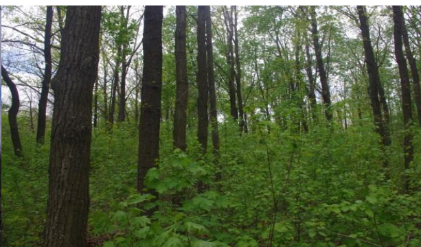
Рис. 3. Дубовые посадки с подлеском между станцией Пионерской и Поляной сказок