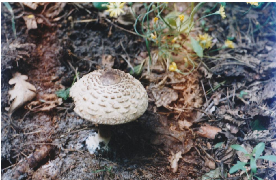
Рис 8. Macrolepiota procera (Scop.)

procera (Scop.) (рис. 8), которые так же являются типичными представителями лесной микобиоты.