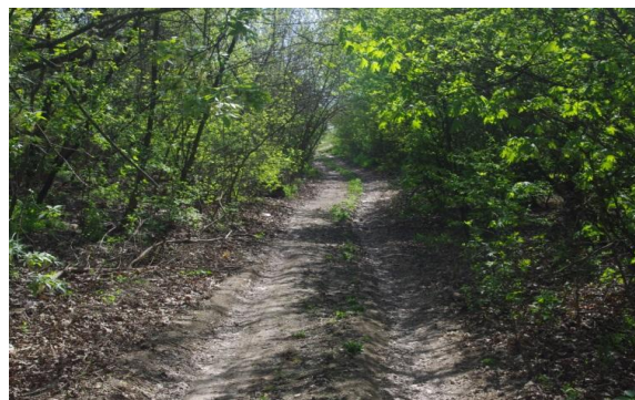
Рис. 7. Подлесок дубовых посадок нижней части парка

На территории этой зоны находятся маленькие остаточные участки придомовых посадок, расположенного ранее частного сектора. Помимо дуба в этой зоне встречаются