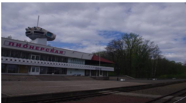
Рис. 2. Вид станции «Пионерская» детской железной дороги