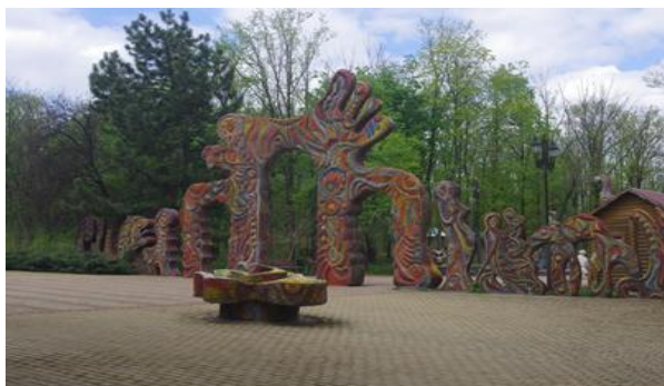
Рис. 4. Входные «ворота» на Поляну сказок