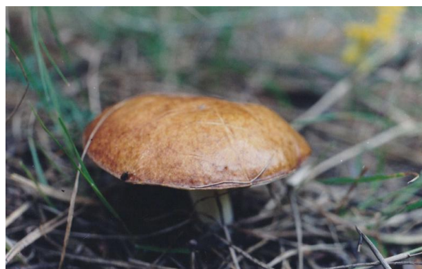
Рис. 9. Suillus granulatus (L.) Kuntze

Необходимо отметить ряд грибов, которые обнаружены в нескольких зонах. Так, во всех пяти исследованных зонах встречался – Stereum subtomentosum Pouzar., в зонах 1, 3 и 4 – Chondrostereum purpureum (Pers.), в зонах 1, 2 и 3 – Tremella mesenterica Retz; в зонах 1, 2