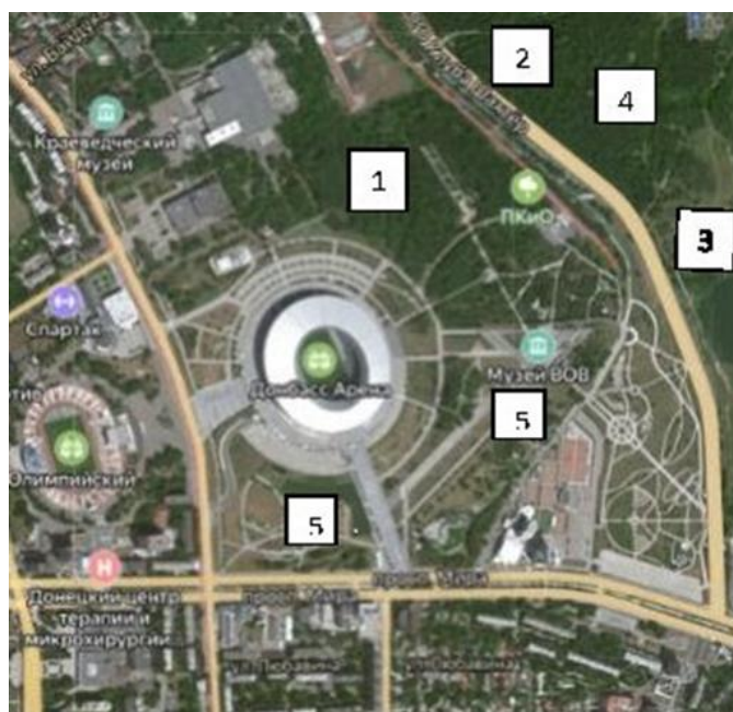
Рис 1. Зоны исследования макромицетов на территории парка им. Ленинского комсомола г. Донецка

Для наших исследований территория парка была условно разделена на пять зон (рис. 1).